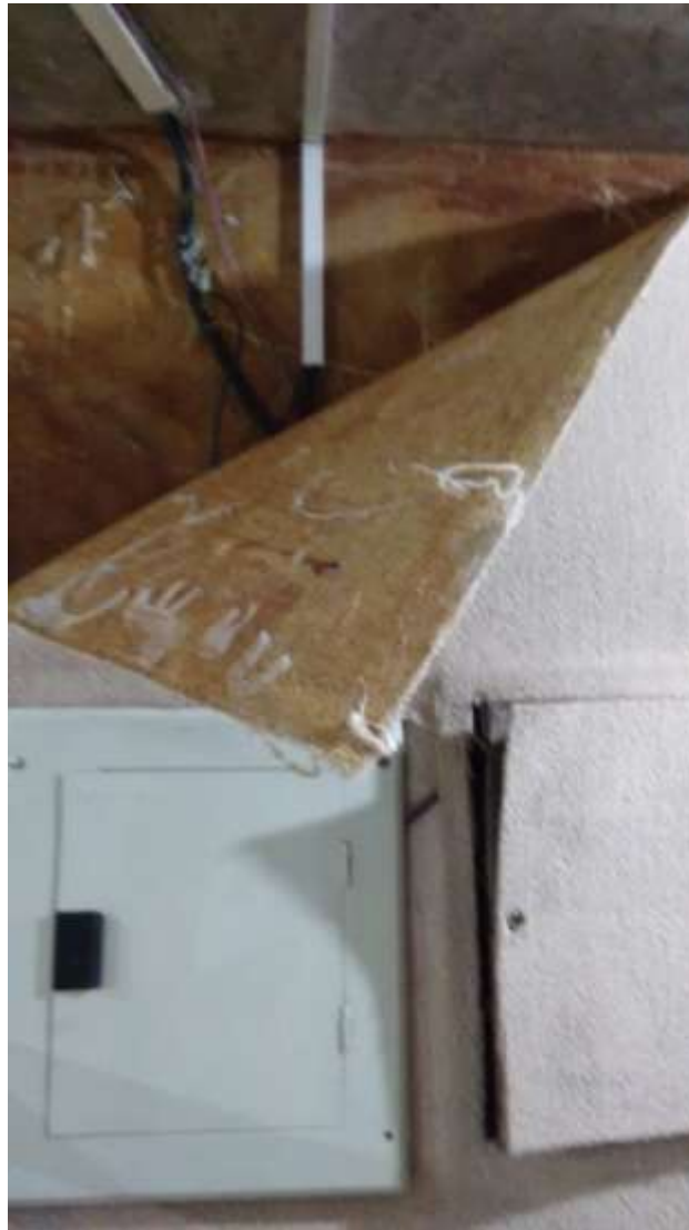
Foto 11 - Caixa de passagem em local inapropriado - 23/04/2015