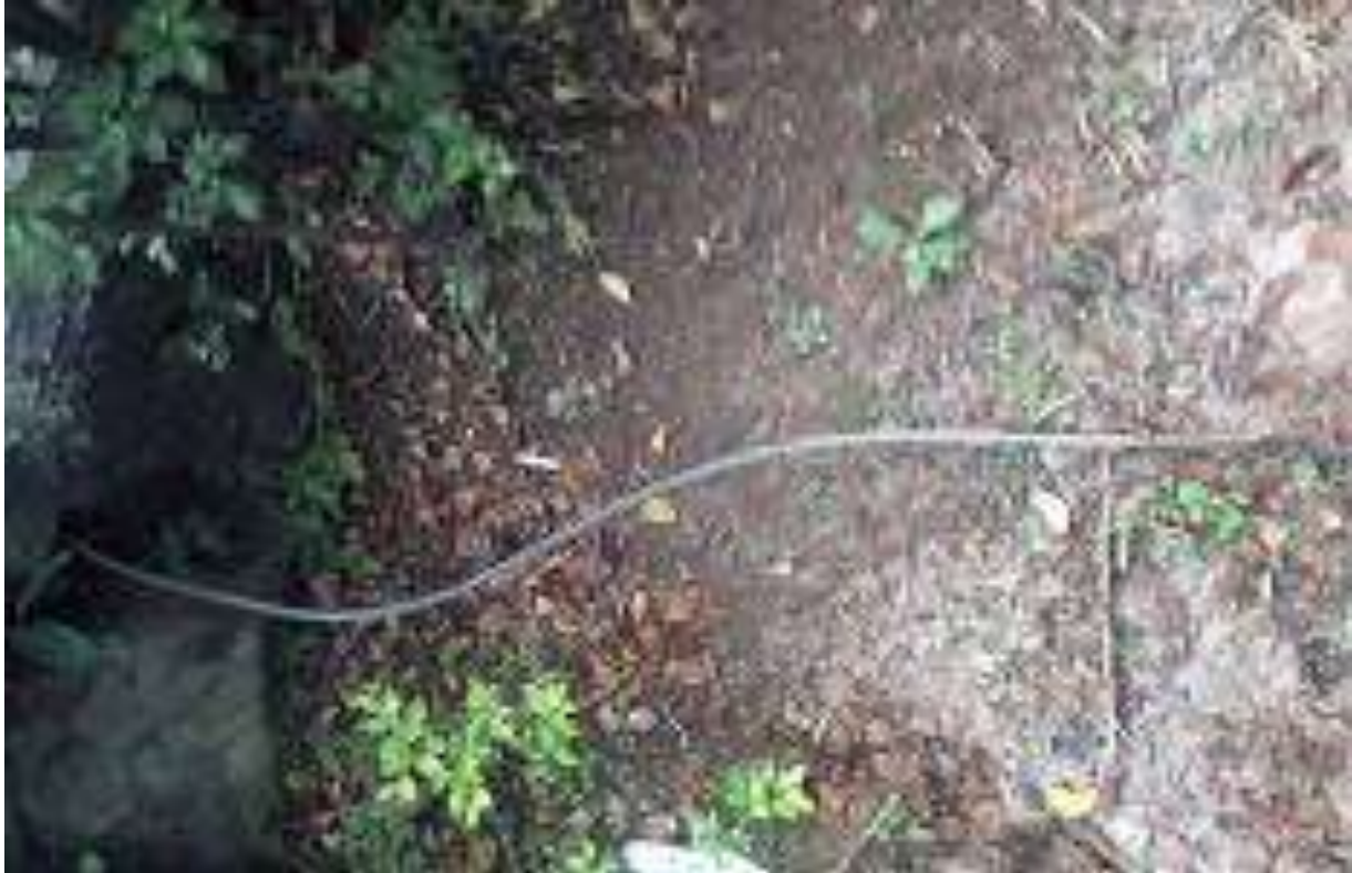
Foto 22 - Cabo aterramento exposto - 23/04/2015