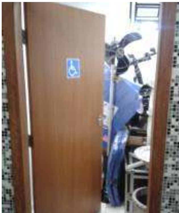
Foto 18 -WC PNE obstruído - 23/04/2015