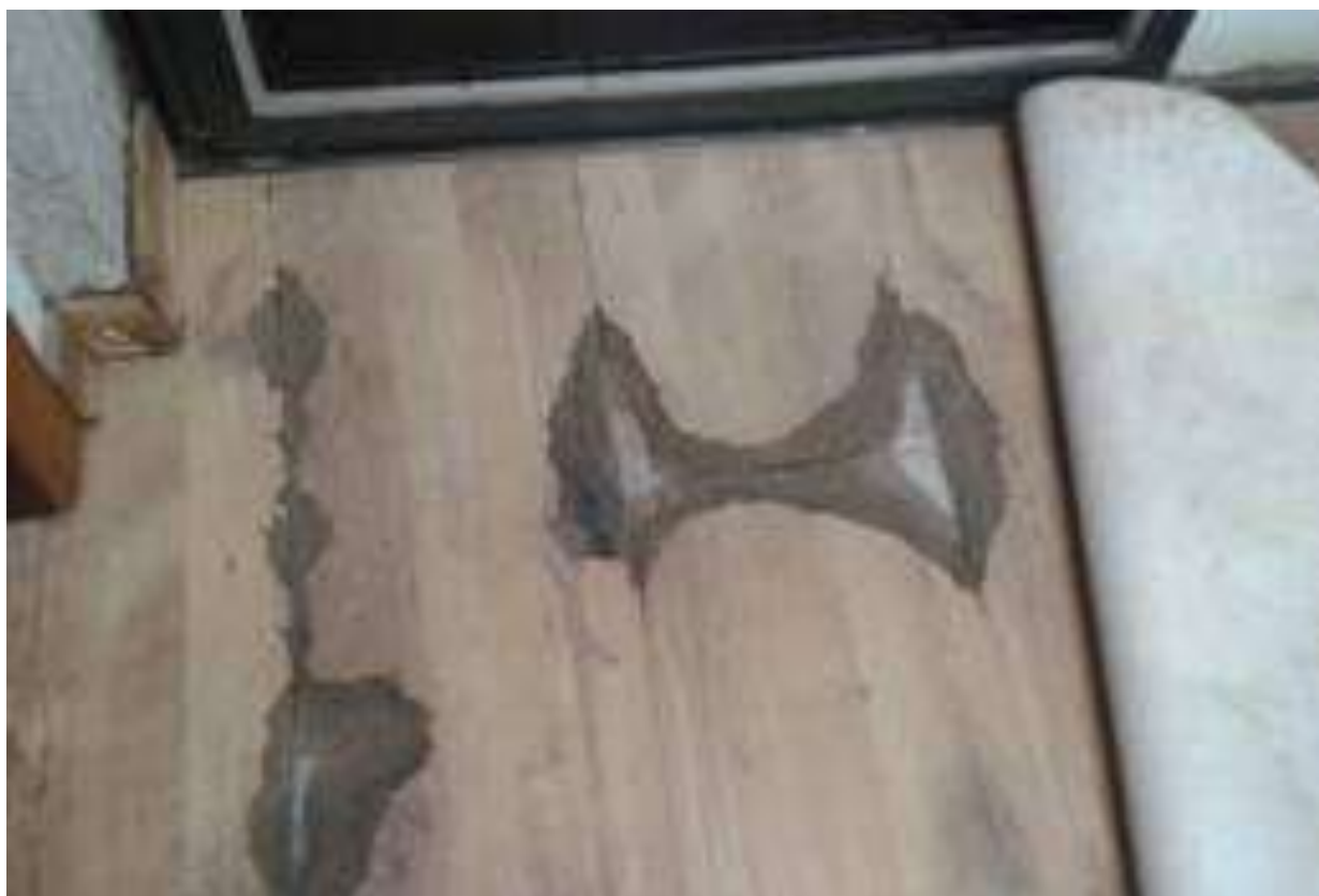
Foto 19 - Piso Danificado - 23/04/2015