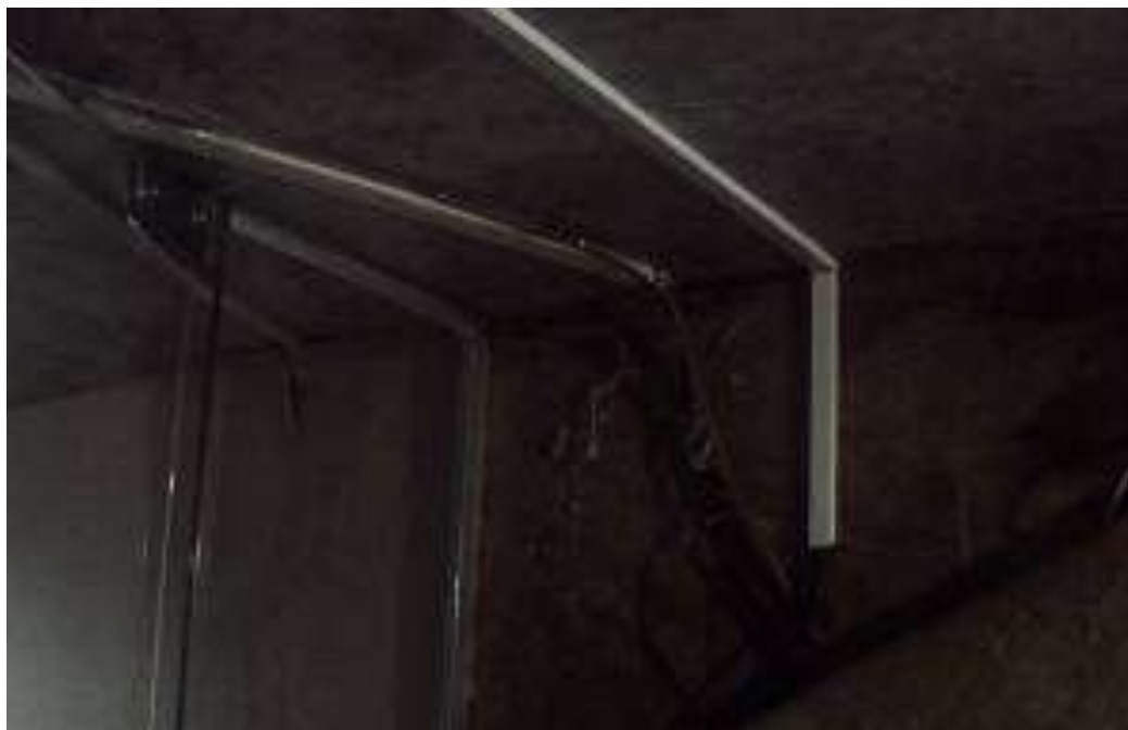
Foto 09 - Fixação incorreta de canaletas - 23/04/2015