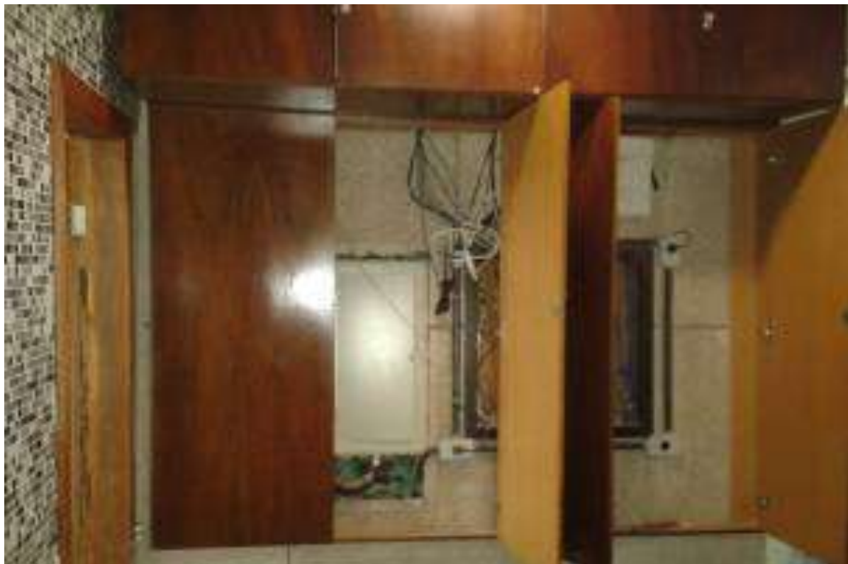
Foto 16 - Acondicionamento de quadro elétrico incorreto - 23/04/2015