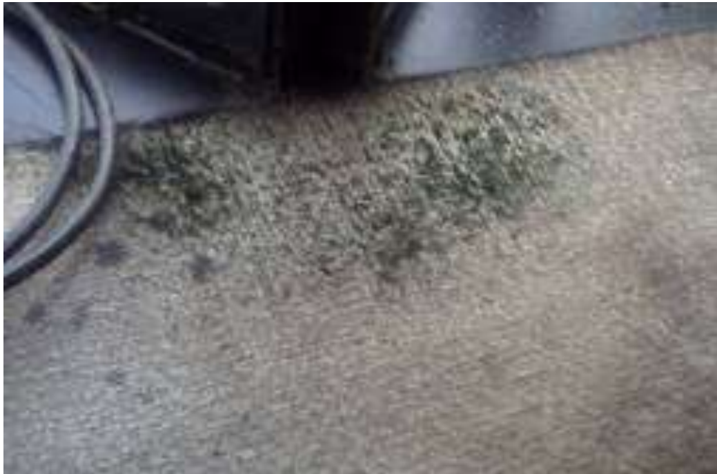
Foto 08 - Carpete com mofo - 23/04/2015 - Fonte: arquivo pessoal da equipe técnica