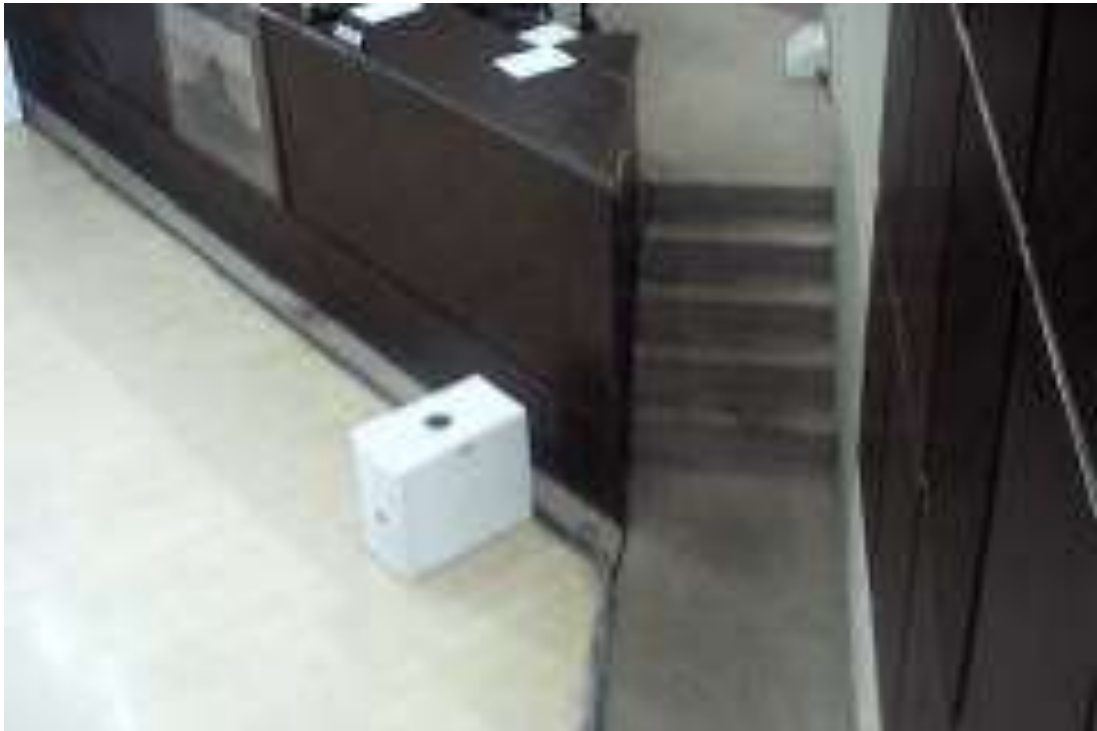
Foto 10 - Caixa de som no piso - 23/04/2015