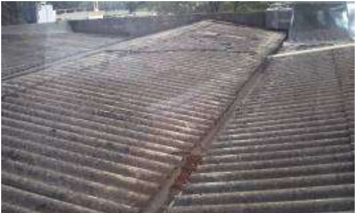
Foto 26 - Telhado danificado - 23/04/2015