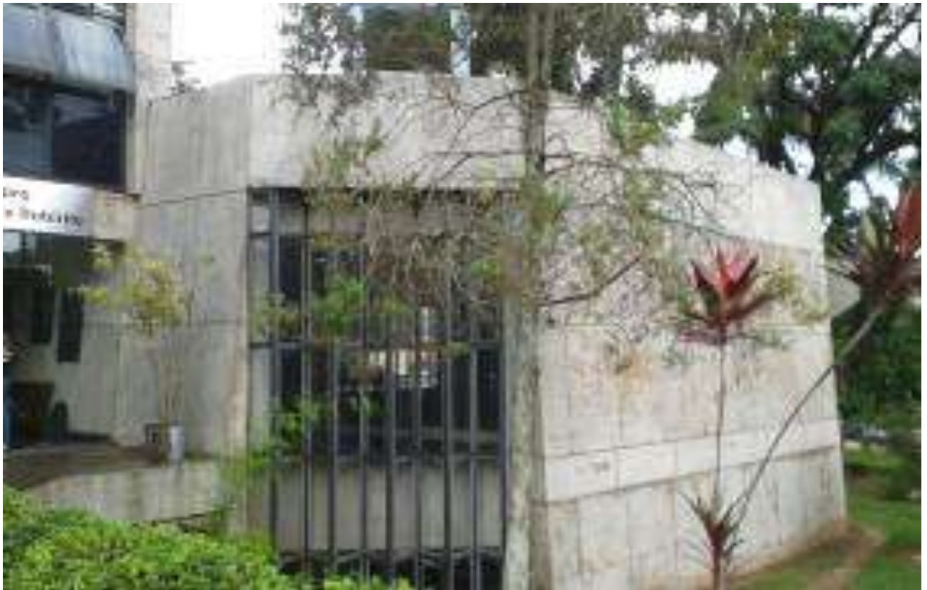
Foto 25 - Ausência de descidas do spda - 23/04/2015