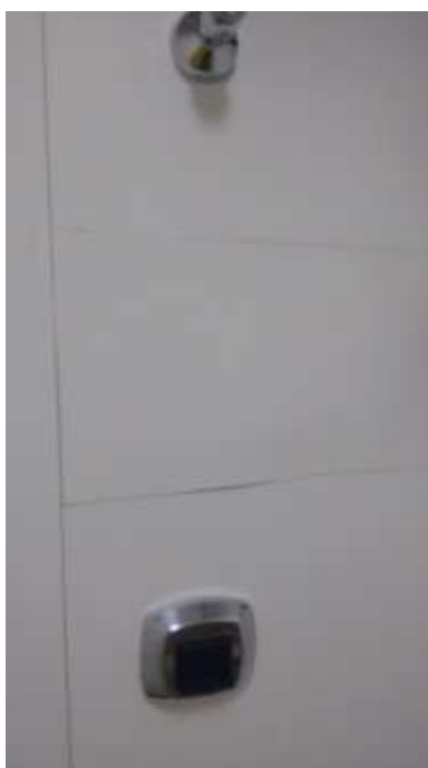
Foto 21 - Revestimento danificado - 23/04/2015