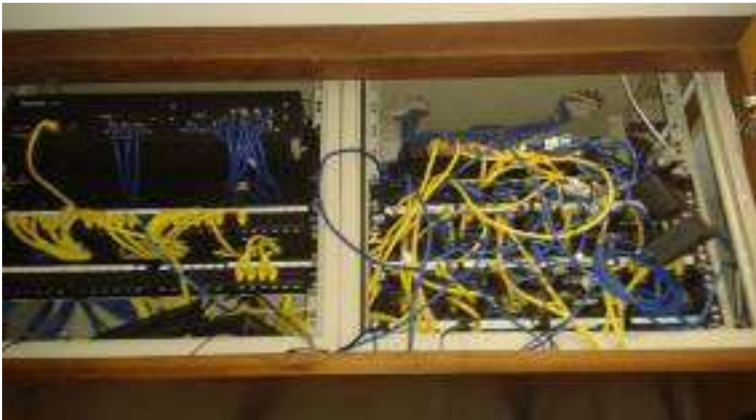
Foto 17 - Cabos do sistema de rede desorganizados - 23/04/2015