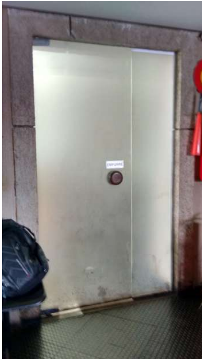
Foto 05 - Rota de Fuga inferior a 1,20m - 23/04/2015