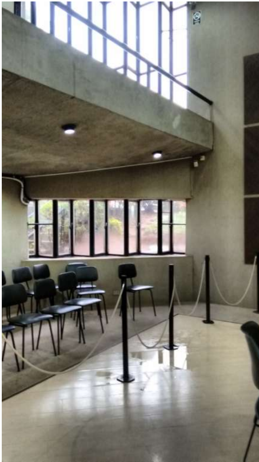
Foto 03 - Goteira em Piso Laminado - 23/04/2015 - Fonte: arquivo pessoal da equipe técnica