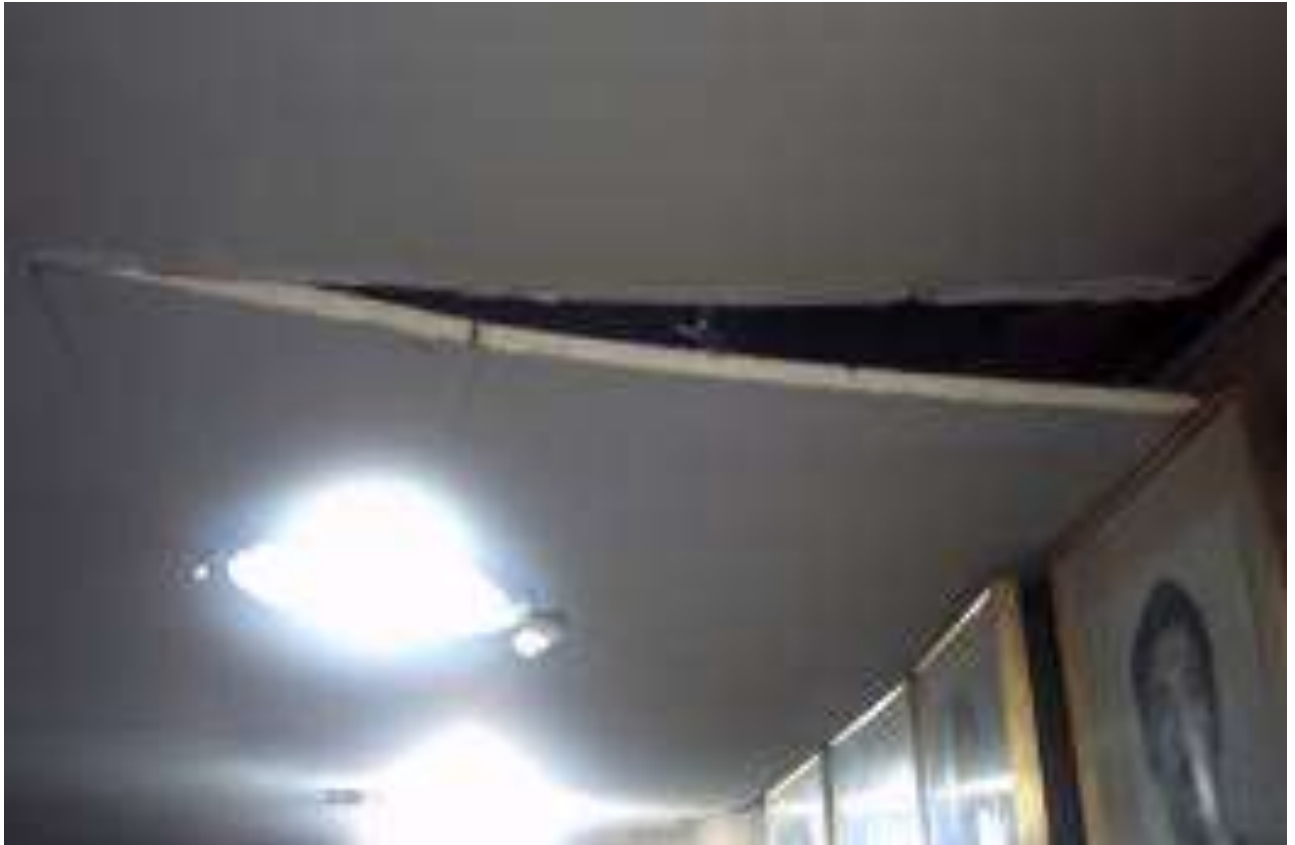
Foto 01 - Teto Deteriorado - 23/04/2015