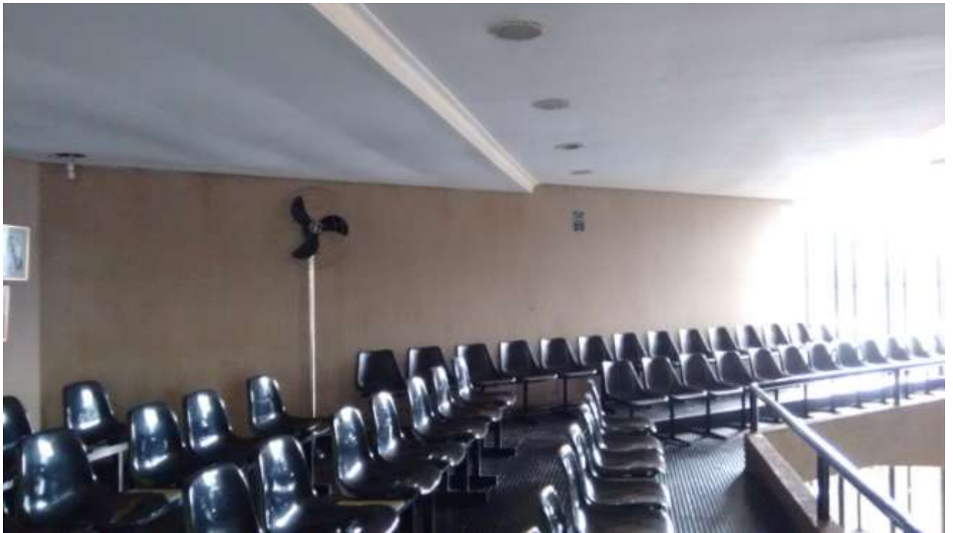
Foto 02 - Piso emborrachado, mobilia antiga, guarda-corpo fora de norma - 23/04/2015 - Fonte: arquivo pessoal da equipe técnica