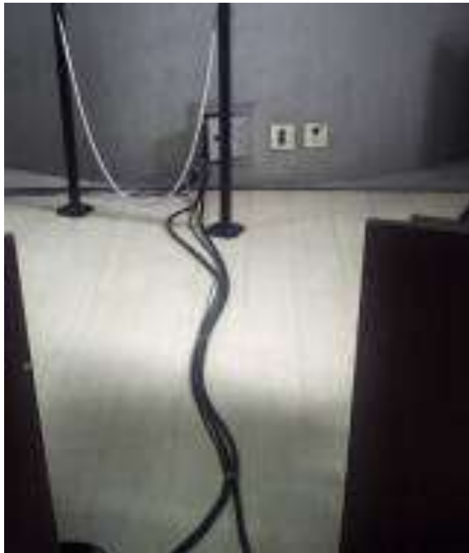
Foto 06 - Cabos desorganizados, sem identificação e expostos - 23/04/2015