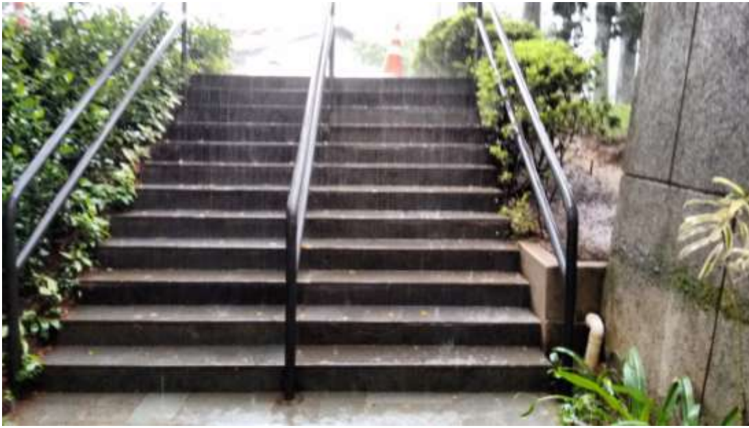
Foto 13 - Escada sem acessibilidade - 23/04/2015