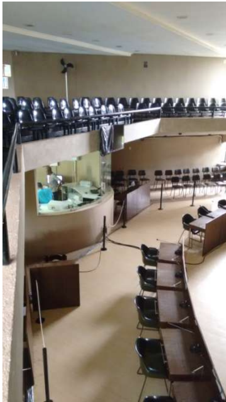
Foto 12 - Iluminação deficiente - 23/04/2015