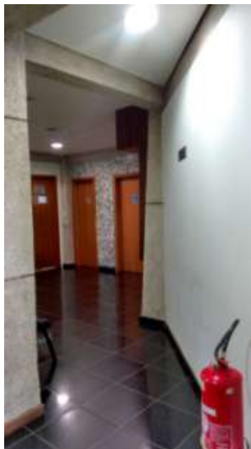
Foto 15 - Extintores sem identificação - 23/04/2015 - Fonte: arquivo pessoal da equipe técnica