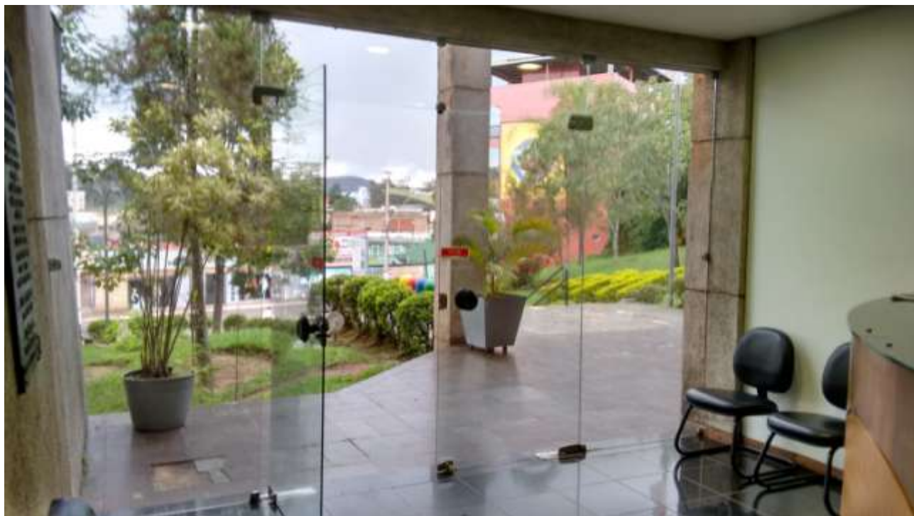
Foto 14 - Porta de acesso em desconformidade - 23/04/2015 - Fonte: arquivo pessoal da equipe técnica