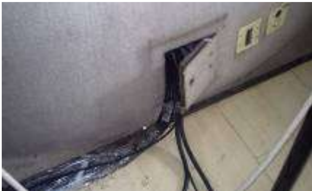
Foto 07 - Cabos desorganizados, sem identificação e expostos - 23/04/2015