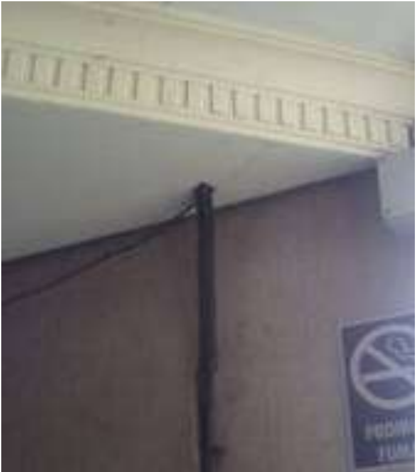
Foto 04 - Instalações Improvisadas - 23/04/2015