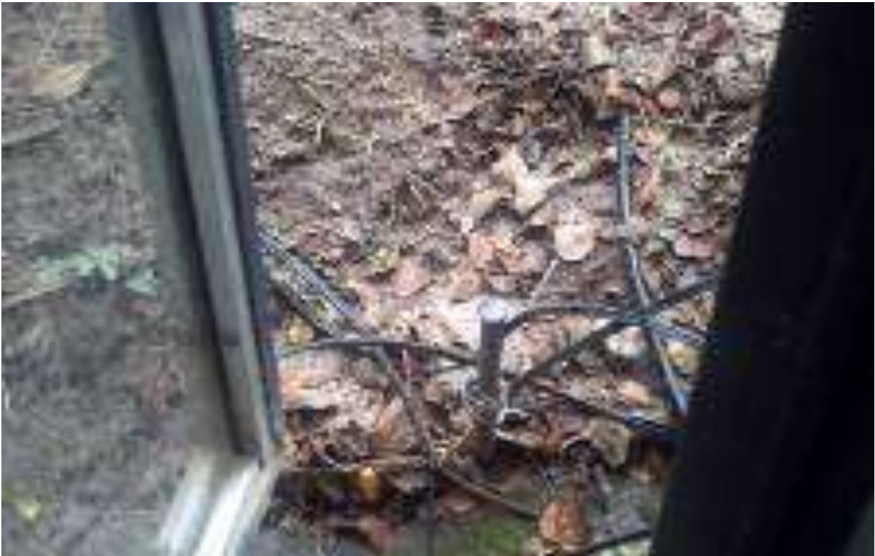
Foto 23 - Haste de aterramento exposta - 23/04/2015