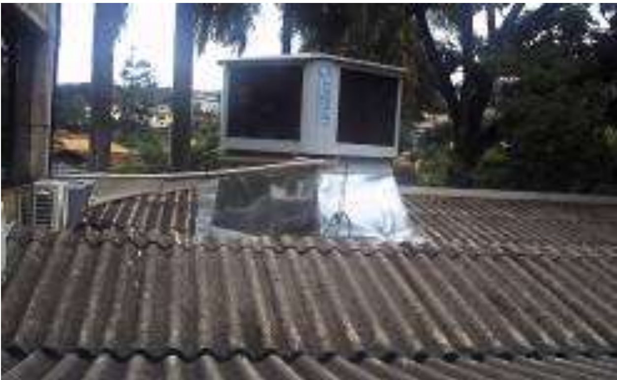
Foto 24 - Ausência de malha de captação - 23/04/2015